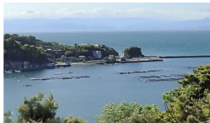
画像上/淡島前を船で 画像下/木負湾

沼津市の南部・・・内浦と西浦の大地は、海底火山由来のユニークな地形と達磨火山が生み出した地形がベースになっています。そして大地に育まれた自然や人々の歴史・文化が盛りだくさんです。海から陸を眺めてみると、いつもとは違う発見がきっとあるでしょう。伊豆半島のジオガイドがその辺りを詳しく解説する所要時間が約60分間のクルージングツアーです。